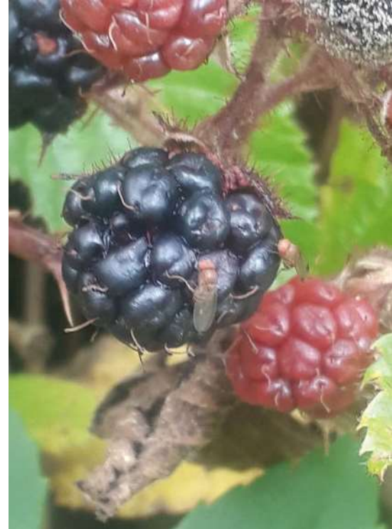
Weibchen (links) und Männchen (rechts) der Kirschessigfliege ( D. suzukii ) auf einer Brombeere Irene Bühlmann

Aktuelle Studien zeigen, dass bewaldete Gebiete hohe Fangzahlen der Fliege und somit wahrscheinlich hohe Populationsdichten aufweisen (Briem et al. 2018). Dies liegt vermutlich daran, dass Nahrung und Eiablagesubstrat konstanter vorhanden sind als im Offenland (vgl. Poyet et al. 2015) und