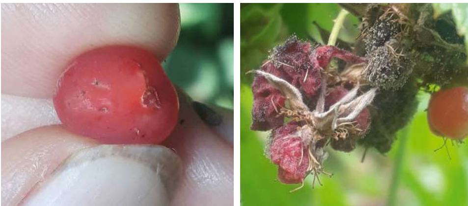
Abbildung 4: Eiablagestellen am Samenmantel der Eibe ( Taxus baccata ) mit ersten Anzeichen eines Schimmelbefalls (links) und Schimmelbefall (vermutlich Botrytis cinerea ) an befallenen Himbeeren ( Rubus idaeus ) (rechts) Irene Bühlmann