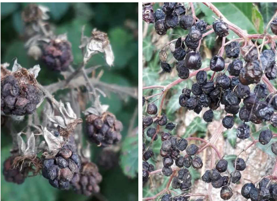
Abbildung 5: Fruchtmumien der Brombeere ( Rubus fruticosus corylifolius agg.) (links) und zerfallende Früchte des Schwarzen Holunders ( Sambucus nigra ) (rechts) Irene Bühlmann