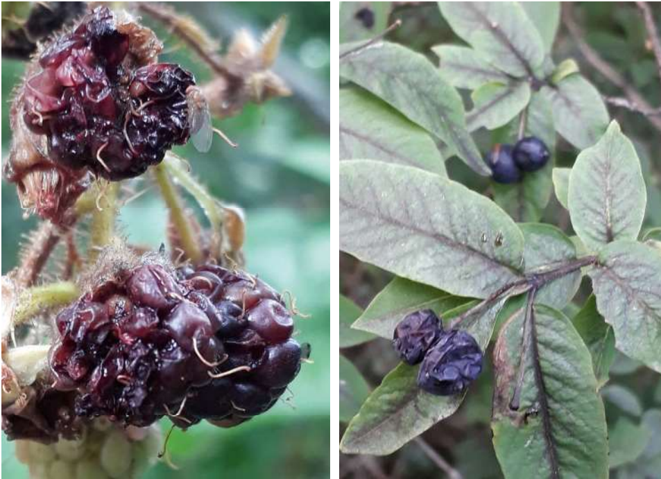
Abbildung 3: Befallene Brombeeren ( Rubus fruticosus corylifolius agg.) (links) und befallene Schwarze Heckenkirsche ( Lonicera nigra ) (rechts) Irene Bühlmann