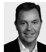
PRÄSIDENT VEREIN AIDS-HILFE ZUG