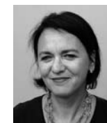
VIZE-PRÄSIDENTIN AIDS-HILFE ZUG