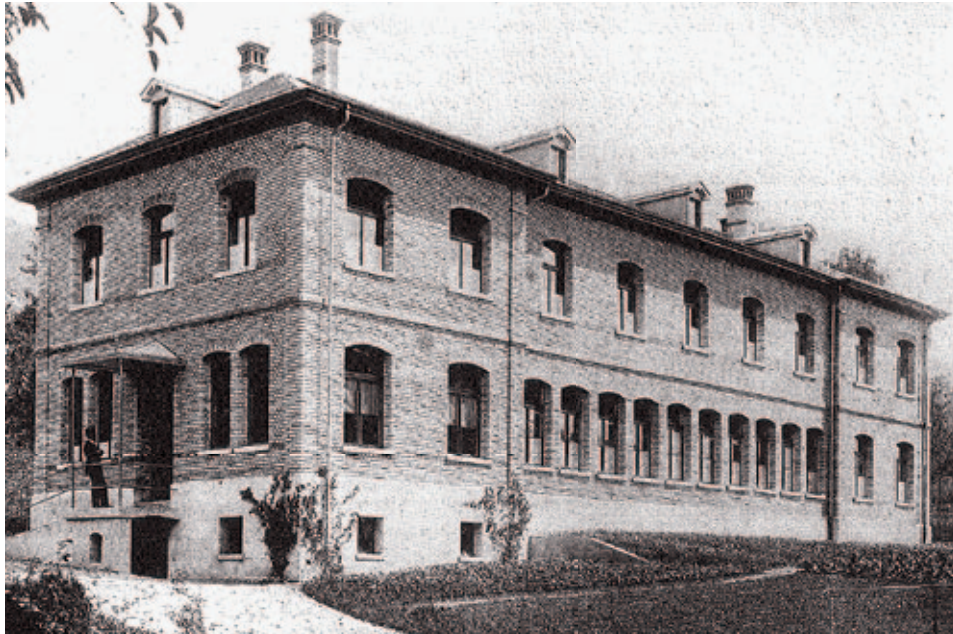
Theilerhaus 1897, Geburtsstätte der Landis & Gyr