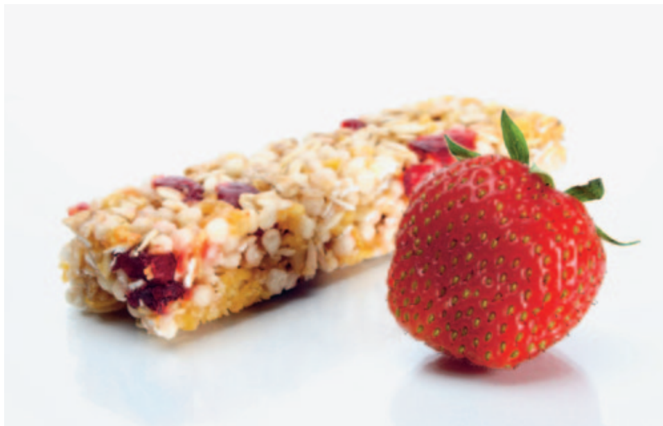
Riegel mit spezieller Haferkleie, der den Cholesterinspiegel senkt

... dass die Haferkleie einer Zuger Firma den Cholesteringehalt im Blut nachweislich reduziert?