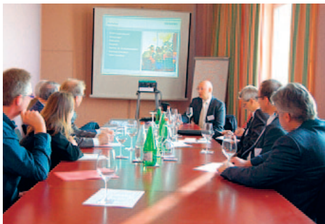
8. Zuger Innovations- und Technologietag

Innovationsfähigkeit ist entscheidend zur Erhaltung des Spitzenplatzes im Standortwettbewerb. Um diese zu fördern, veranstaltet das Zuger Technologie Forum jedes Jahr einen Innovations- und Technologietag mit Verleihung des Zuger Innovationspreises.