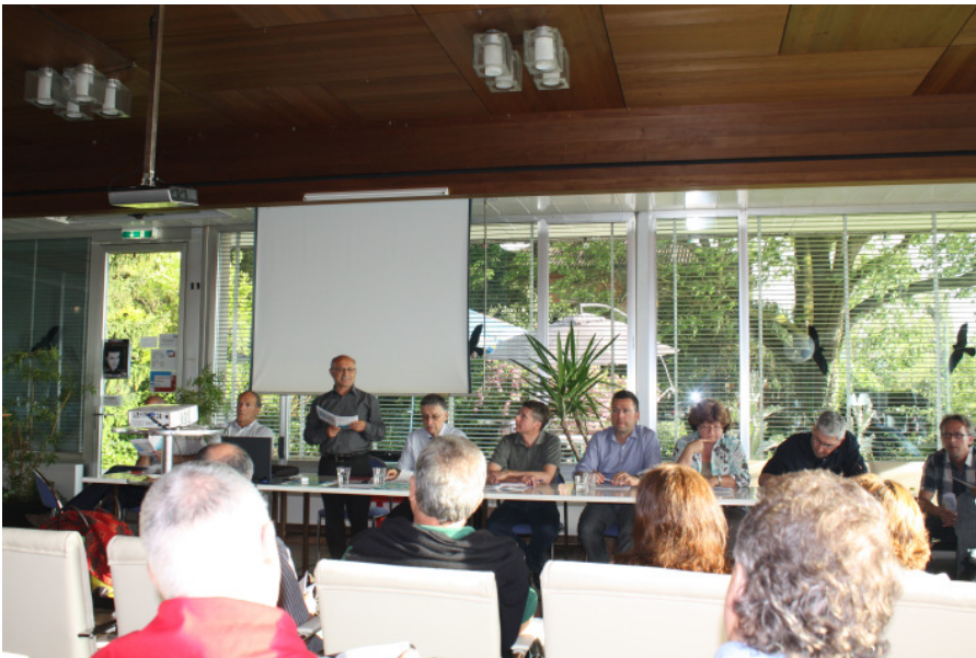
Generalversammlung des Vereins für die Beratung der ausländischen Arbeitnehmenden in den Räumlichkeiten des Türkischen Vereins Zug, mit dem herrlichen Blick auf den Zugersee.

gration angemeldet werden, werden bei FsM erfasst. Bei diesen Angaben kann es zum Teil auch um Personen handeln, welche wieder einreist sind oder deren Aufenthalt neu geregelt wurde (Umwandlung vom Asylstatus zum Flüchtling, insgesamt 33 Personen) oder aber sind es Personen, welche als Besucher mit einem Visum einreisen. Deshalb müssen diese Angaben mit Vorsicht betrachtet werden.