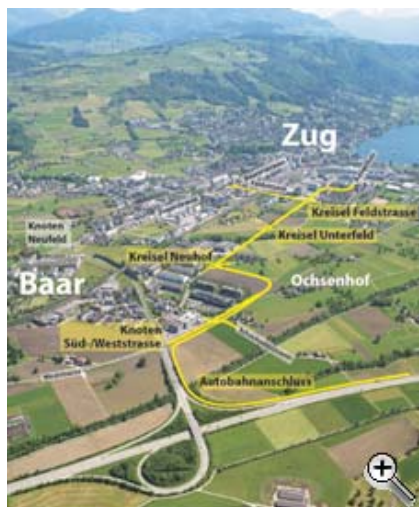
Linienführung der Nordzufahrt

Einen ersten Erfolg kann das Agglomerationsprogramm bereits verzeichnen: In der bundesrätlichen Botschaft zum Infrastrukturfonds für den Agglomerationsverkehr und das Nationalstrassennetz werden als erste Tranche gesamtschweizerisch 2,3 Milliarden Franken freigegeben. Dieses Geld ist für heute dringende und baureife Projekte im Agglomerationsverkehr vorgesehen. Auch der Kanton Zug wird davon profitieren. Der Bundesrat unterstützt die erste Teilergänzung der Stadtbahn Zug mit 25 Millionen Franken. Vorgesehen ist der Doppelspurausbau Freudenberg - Rotkreuz sowie ein drittes Gleis für die Strecke Bahnhof Zug - Lindenpark. Den kantonalen Teil der Nordzufahrt unterstützt der Bund mit zusätzlichen 35 Millionen Franken, zudem finanziert er 84 Prozent der Kosten des nationalen Teils.