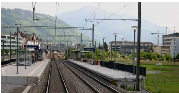
Zwischen dem Bahnhof Zug und der Haltestelle Lindenpark ist ein drittes Gleis geplant

Das ARP hat zusammen mit Vertretern des ARE die Zwischenbeurteilung eingehend besprochen und ist daran, das Agglomerationsprogramm zu überarbeiten. Die bereinigte Fassung soll im Rahmen der Anpassung des kantonalen Richtplans nach der öffentlichen Mitwirkung und der Beschlussfassung durch den Kantonsrat bis Ende 2006 dem Bund zur Genehmigung eingereicht werden.