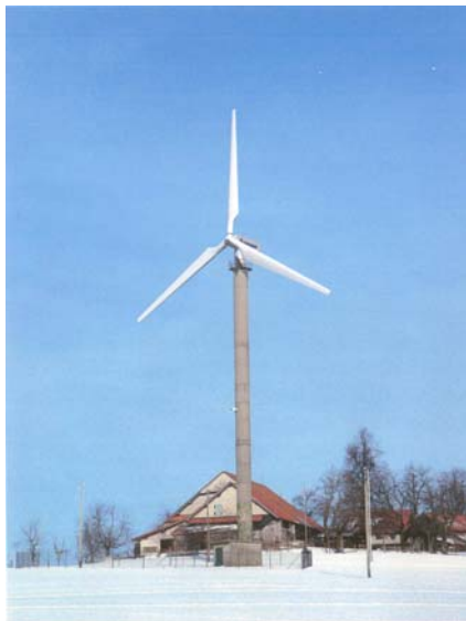
Windkraftanlage auf dem Gubel (Fotomontage)

Eine Interessengemeinschaft beabsichtigte, auf dem sogenannten Kollimationsturm, welcher der Zieljustierung für die ehemalige Lenkwaffenstellung Gubel diene, eine Windkraftanlage aufzubauen. Dieser Turm steht unter kantonalem Denkmalschutz. Das Verwaltungsgericht wies die Beschwerde gegen die Ablehnung des Baugesuches gestützt auf ein Gutachten der eidgenössischen Natur- und Heimatschutzkommission sowie aus denkmalpflegerischen Gründen ab. Das Gericht hob besonders die landschaftliche Empfindlichkeit des Standortes hervor. Dieser liegt in einem Gebiet, das im Bundesinventar der Landschaften und Naturdenkmäler von nationaler Bedeutung (BLN) enthalten ist. Die grossartigste Moränenlandschaft der Schweiz bedürfe der ungeschmäleren Erhaltung oder jedenfalls der grösstmöglichen Schonung, hielt das Verwaltungsgericht fest. Ein Abweichen von der ungeschmäleren Erhaltung im Sinne der Inventare darf bei der Erfüllung einer Bundesaufgabe nur in Erwägung gezogen werden, wenn ihr bestimmte gleich- oder höherwertige Interessen von ebenfalls nationaler Bedeutung entgegenstehen. Diese Voraussetzung ist gemäss dem Verwaltungsgericht nicht gegeben. Das Interesse an der integralen Erhaltung des BLN-Objektes Nr. 1307 geht der Produktion einer kleinen Menge Ökostrom vor.