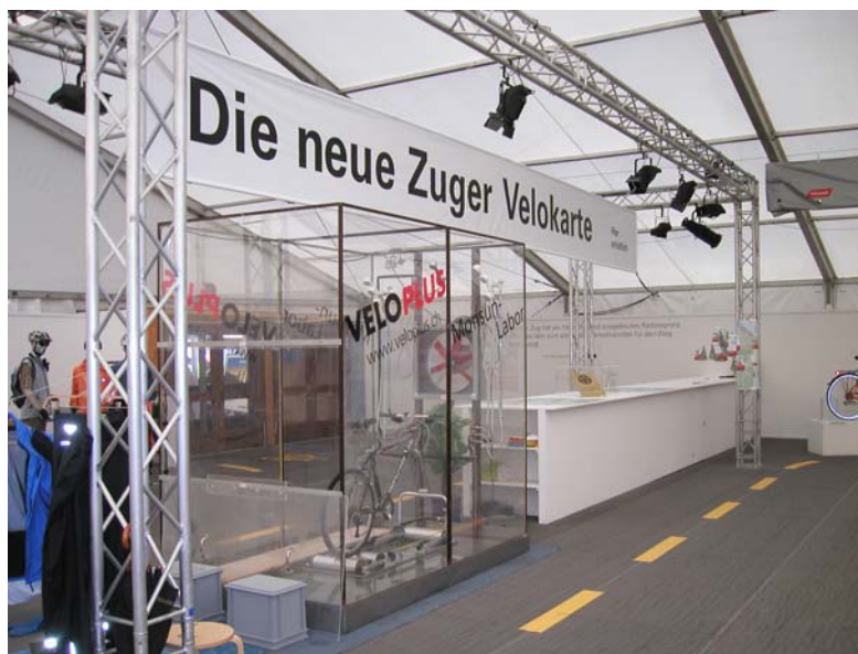
Stand des Amtes für Raumplanung an der Zuger Herbstmesse 2005

Bei der Gestaltung der 300 m 3 grossen Ausstellungsfläche wurde viel Wert auf eine offene, grosszügige und relativ schlichte Präsentation gelegt. Der Boden wurde mit Dachpappe ausgelegt, was optisch einem Strassenbelag sehr nahe kam. Darauf wurden gelbe Velomarkierungen gespritzt. Diese beiden Elemente führten die Besucher auf einem "Veloweg" durch die Ausstellung.