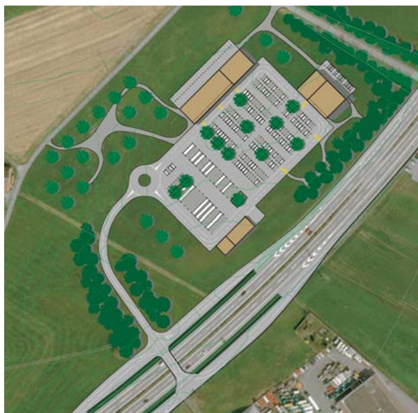
Projekt Raststätte Zugerhof, (Quelle: Raststätte Zugerhof, Bericht der Initianten, Gewerbeverband Zug/Zug TOURISMUS)

Das Bundesamt für Strassenbau übermittelte dem Kanton Zug das Projekt für eine Autobahnraststätte im Knonaueramt zur Stellungnahme. Der Regierungsrat diskutierte das Geschäft an seiner Sitzung vom 1. Februar 2005 und beauftragte die Baudirektion, im Sinne dieser Diskussion die Stellungnahme des Kantons zu verfassen. Die Baudirektion liess sich zuhanden des Bundesamtes für Strassen ASTRA wie folgt vernehmen: "Der Kanton Zug hat keine grundsätzlichen Einwände gegen das Projekt einer Autobahnraststätte im Knonaueramt. Er bzw. private Investoren behalten sich jedoch vor, im Verlaufe dieses Jahres ein Projekt für eine Autobahnraststätte in Rotkreuz dem Bund zur Prüfung (Anhörungsverfahren) einzureichen. Eine auf privater Basis erstellte Projektskizze liegt bereits vor, wobei seitens des Regierungsrates noch Vorbehalte zum konkreten Standort bestehen. Das Projekt der Autobahnraststätte im Knonaueramt darf somit keine negativ präjudizierende Wirkung auf eine allfällige Zuger Raststätte in Rotkreuz haben und ein späteres Projekt im Raum Rotkreuz nicht verhindern".