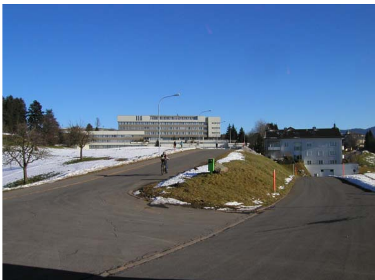
Beurteilung der Siedlungsentwicklung der Gemeinde Menzingen im Gelände

Der Gemeinderat Menzingen musste mit einem sehr kleinen Spielraum kämpfen. Dort, wo der kantonale Richtplan eine grosszügige Siedlungsentwicklung zulies, waren die Grundeigentümer nicht bereit, das Land zur Verfügung zu stellen. Alternativen bieten sich aus landschaftlicher Sicht nur im beschränkten Rahmen an. Der Entwurf der Ortsplanung enthielt deshalb sehr umstrittene Einzonungen, was zu einer Premiere führte. Die Siedlungsentwicklungen wurden durch die kantonalen Fachstellen und einer grossen Vertretung der Gemeinde Menzingen im Gelände beurteilt. Gestützt auf diesen Augenschein unterbreitete die Baudirektion im Vorprüfungsbericht konkrete Vorschläge für die Siedlungsentwicklung.