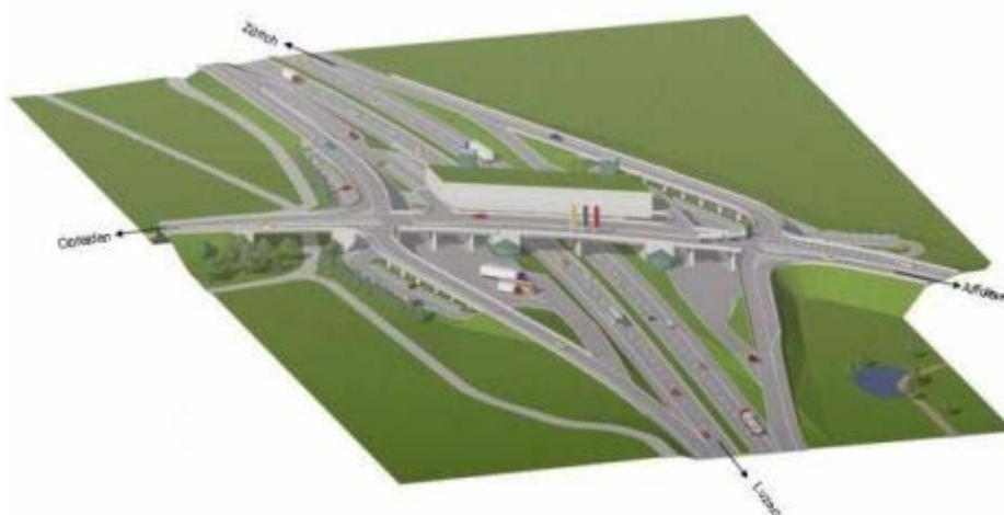
Projekt Autobahnraststätte Knonaueramt