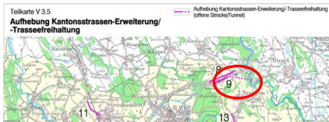
Ausschnitt aus der Richtplan-Teilkarte V 3.5