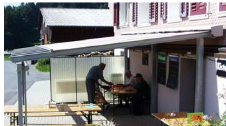
Nebenbetrieb "Besenbeiz", Hinter Schneit, Gemeinde Oberägeri