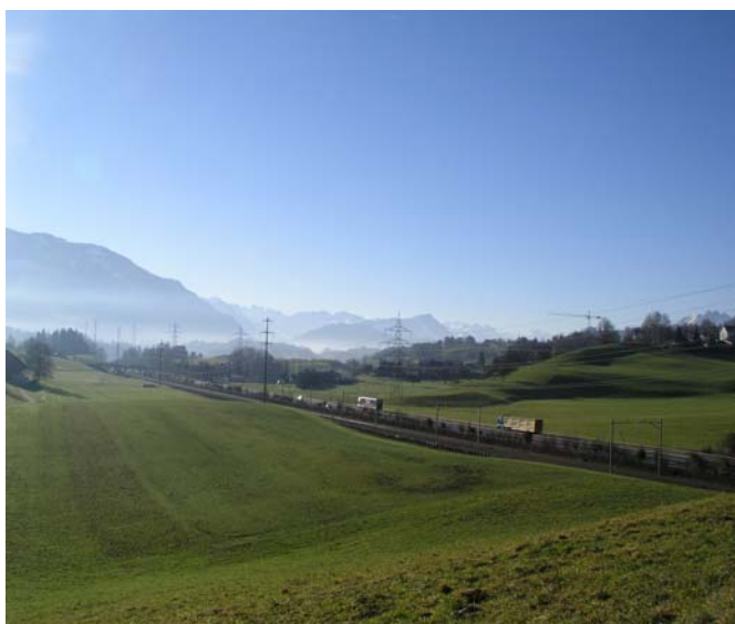
Standort Deponie Stockeri, Blickrichtung Südwest

Der Regierungsrat bittet Bundesrat Leuenberger, die Genehmigung des kantonalen Richtplanes nun vordringlich an die Hand zu nehmen, da im Kanton Zug die Genehmigungen der Ortsplanungen anstehen.