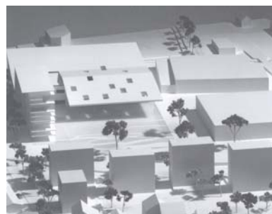
Neues Eisstadion in Zug