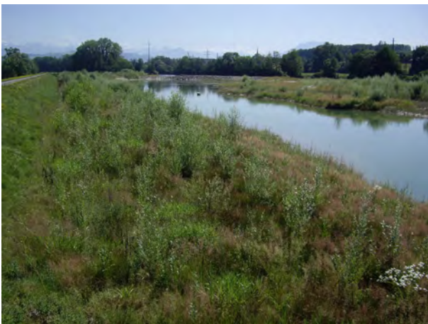
Naturschutzgebiet „Rüssweiden“ in Hünenberg (Reussdammaufweitung Chamau)

Schliesslich wurden für zwei neue Naturschutzgebiete die Schutzpläne erarbeitet: